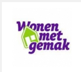
Wonen met Gemak