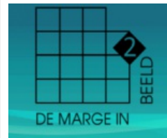
Marge in beeld 2