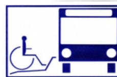
Stichting Rolerisuit Breda